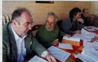
Le jury du concours, organisé par La Baie en poésie, au cours des délibérations.